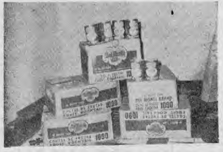
Estas cajas son parte del contrabando de latéxina fina capturado por el Resguardo de Alajuela ayer en la mañana. Los propietarios se encuentran a la orden del Juez Penal de Hacienda.